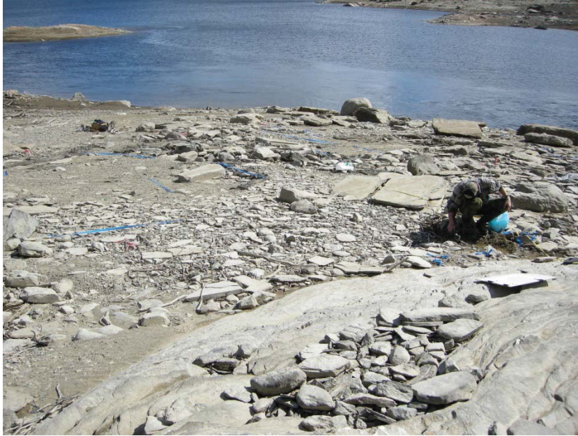
Fig. 2. Arkeolog Lars Backman rensar fram gravarna vid F7. Gravarna ligger alldeles intill berg i dagen. Fotograferat från NV. Foto acc nr: 2012:52:6