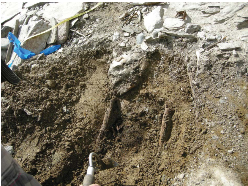
Fig. 1. Området vid lösfynd F7 visade sig vid framrensning innehålla minst två relativt intakta gravar. Här Grav XXVI. Foto acc nr: 2012:52:11, Åsa Lindgren © Norrbottens museum

De ytligaste liggande benen tillvaratogs från en kontext som tolkades som tre gravar (Grav XXVI – XXVIII, bilaga 2). Minst två gravar ligger kvar delvis intakta. Vid F9 såg den underliggande marken omrörd ut, så som i de tidigare undersökta gravarna (2004 och 2005), men inga ytterligare ben framkom i ytan.