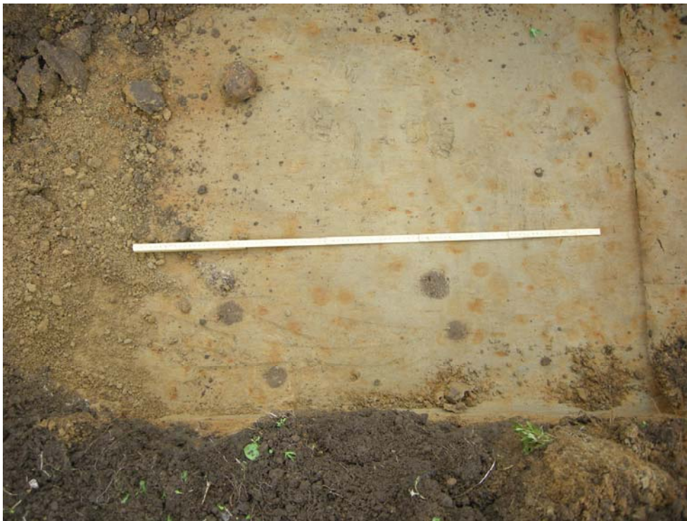
Fig. 2 Schakt 7, lodfoto. De små stolphålen som uppträdde ca 2,5 m in i schaktets S ände. Nbm acc nr 2011:114:019