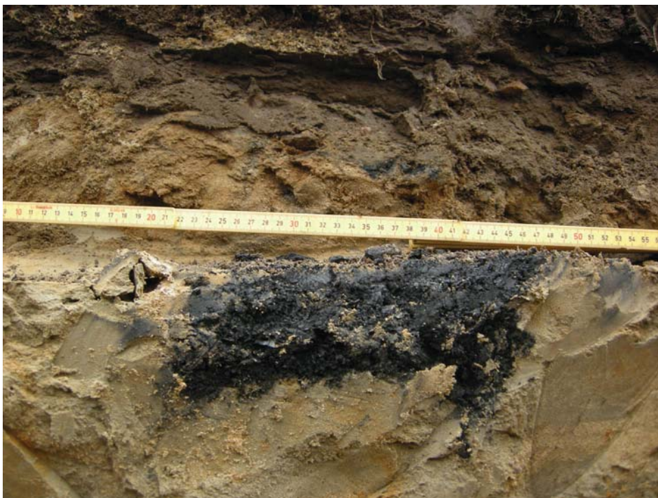
Fig. 1 Schakt 6, fotograferat från NNÖ. Profil av kolfläcken. Nbm acc nr 2011:114:016