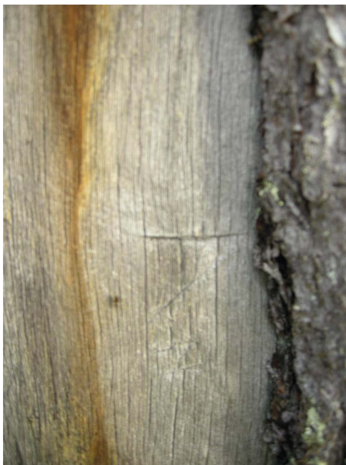
Bläckning med inskription "AH", Tillfälligt id-2, Nbm acc nr 2010:245:05.

Malmfyndigheterna i Mertainen upptäcktes i 1897 av gruvingenjören Carl Immanuel Asplund. Arbeta med blottning av malmkroppen började direkt och i 1899 var Mertainen belagt med hela 15 utmål. I det nybildade bolaget Mertainen grufaktiebolag var också många av lokalbefolkningen med som intressenter, malmkroppen låg ju på mark som tillhörde Svappavaara by. Undersökningarna fortsatte i 1901, men samlad malm i någon större mängd förekom inte. Transporterna var också ett problem. Det fanns ingen järnväg eller ens någon riktig väg förbi Mertainen på denna tid och bolaget var starkt skuldsatt då staten övertog malmfältet i 1907. På uppdrag av den statliga malmkommissionen genomfördes nya undersökningar i åren 1918-20. De långa jordrymningarna som hittas på bergets sydvästra sida härstammar från denna tid. Man drev också en 390 meter lång stollgång in i berget. Resultaten av alla undersökningarna verkade mycket lovande och planer lades för brytning i stor skala, men depressionen på 1920-30 talet satte en stopp för detta. På slutet av 1950-talet togs brytningen upp igen då Norrbottens Järnverk anlade det nuvarande dagbrottet i 1956. Arbetena avslutades redan efter två år, i 1958, på grund av svikande stålpriser på världsmarknaden.