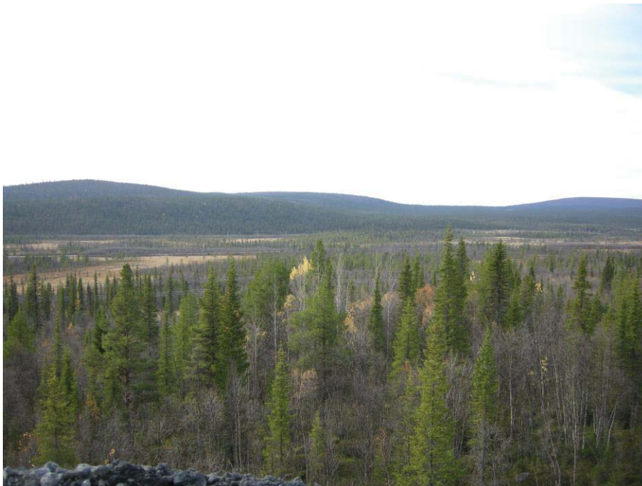
Vy från varphögen nedanför dagbrottet mot sydväst och planerad krossupplaga och transportväg. E10;an i bakgrunden. Nbm acc nr 2010:245:06

Denna förstudie ska inte förväxlas med en särskild arkeologisk utredning som begärs av Länsstyrelsen. En sådan kan bli aktuell om Länsstyrelsen finner att det är nödvändigt att utföra en särskild arkeologisk utredning, enligt 11§ 2 kap. i kulturminneslagen (SFS 1988:950).