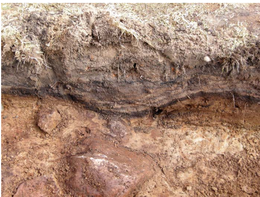
Fig. 1 Schaktets NÖ profil taget ca 4 m SÖ om Pitegårdens gavel. I gropen (som är naturlig) syns tydligt de avsatta lagrens olika färgningar (randigt), samt det underliggande mörkbruna kulturlagret ovan den naturliga ljusbruna sanden. De otydliga färgningar som anslöt till stenen på bilden var tyvärr bortgrävda när bilden togs.

Under det 5 cm tjocka torvlagret var ett påfört, omrört fyllnadslager 5-40 cm tjockt, med rikligt innehåll av tegel, tegelkross, sot och kol. Detta lager återfanns i hela schaktlängden. Närmast Pitegården och ca 3 m ut i schaktet var det tjockast och gick ända ner till orörd mark (se ritning 1, bilaga 2). Längre mot SÖ framkom intakta fyllnadslager av sand och lera, vilka påförts i olika omgångar till ca 15 cm tjocklek (se fig 1). Lagren innehöll sparsamt med sot och i botten fläckvisa inslag av halm. Detta vilade på ett ca 5 cm tjockt kulturlager som var fett, humöst med fläckvisa inslag av sot och kol utan struktur. Vid rensning av profilen ramlade en liten bit porslin fram, osäkert från vilket lager, men troligen från kulturlagret. I botten av detta, mot den orörda sanden, var otydliga färgningar, vilka anslöt till en större sten som framkom i schaktets botten (se ritning 1, bilaga 2).