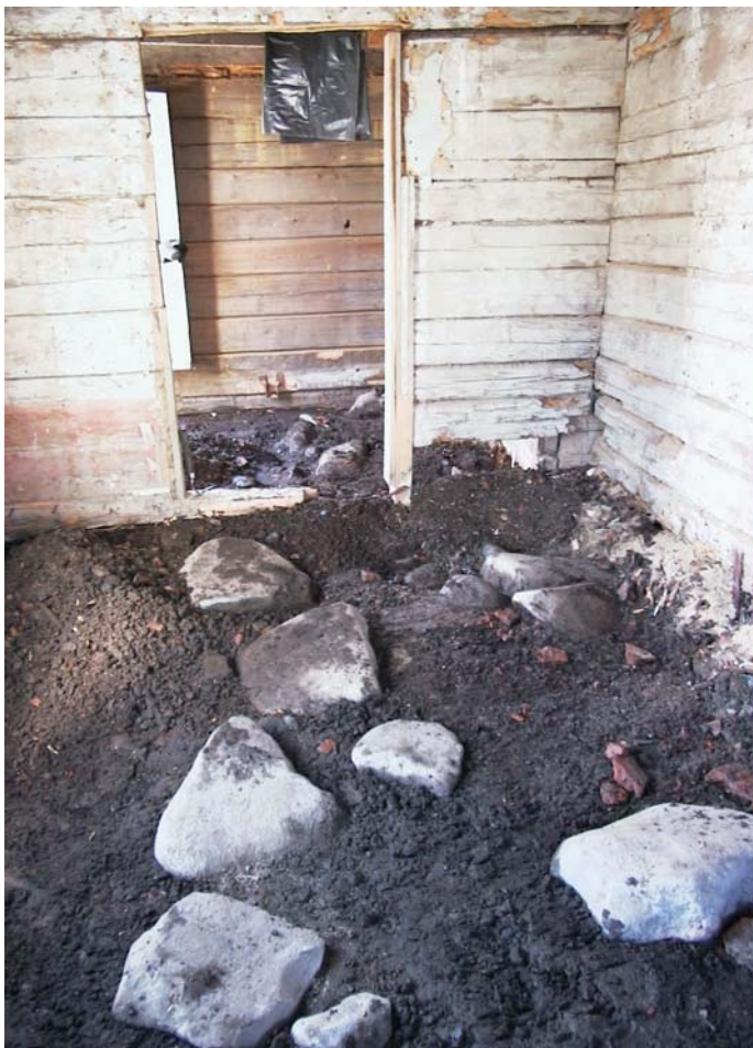
Fig. 1. Syllstenar inne i kyrkstugan, foto taget mot söder. Acc nr: 2005:207:2.

Förundersökningen utfördes enligt Länsstyrelsens beslut som en förundersökning/schaktkontroll genom att gräva sökchakt/provgrovar inom golvytan till kyrkstuga 317 (ritning 1, bilaga 3). Efter att golvet tagits bort, syntes rubbade äldre syllstenar i N-S riktning (se fig 1). Provruta I grävdes i den norra delen och mätte 1x1 m. Den grävdes ner 5-10 cm och ritades, därefter grävdes den ner till 30 cm djup där orörd sand och vatten tog vid. Inget av antikvariskt intresse framkom.