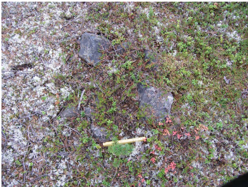
Fig. 1. Härd. Fotograferad från S.