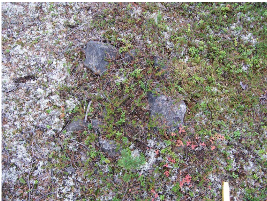
Fig. 2. Härd. Fotograferad från S.