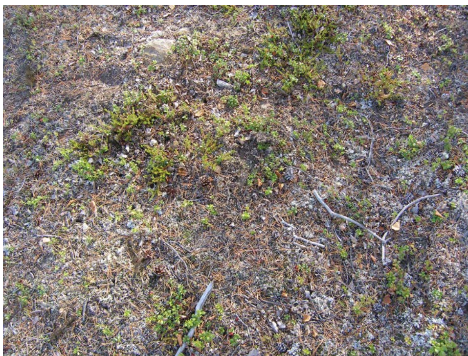
Fig 4. Härd Raä 1966 fotograferad från N.