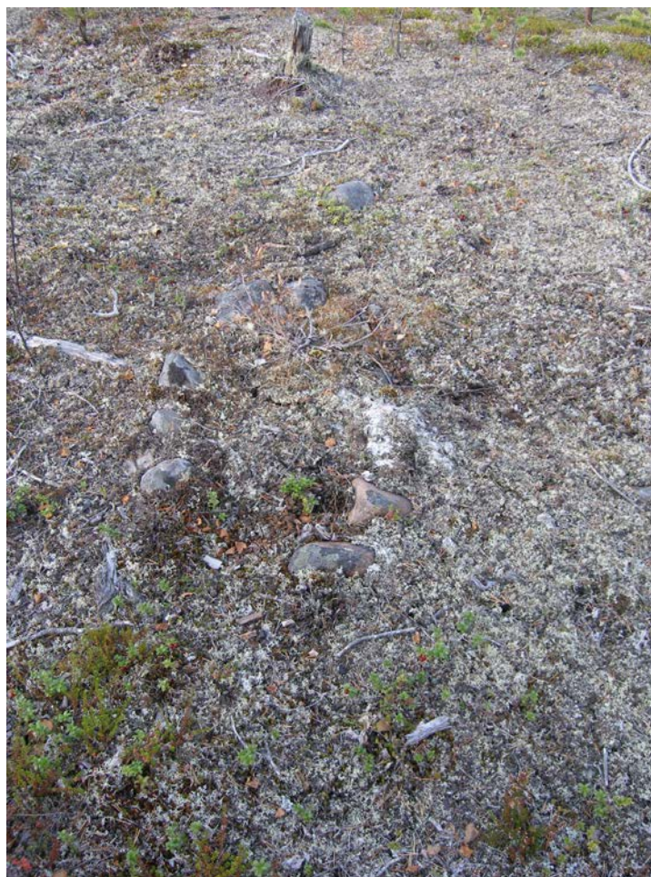
Fig 8. Hård Raä 1424 fotograferad från S.