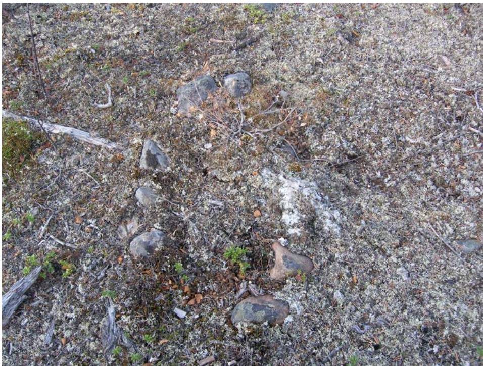
Fig 7. Hård Raä 1424 fotograferad från S. © Nbm acc nr 2006:393:7