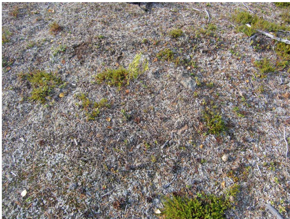
Fig 2. Hård Raä 1965 fotograferad från Ö. © Nbm acc nr 2006:393:2