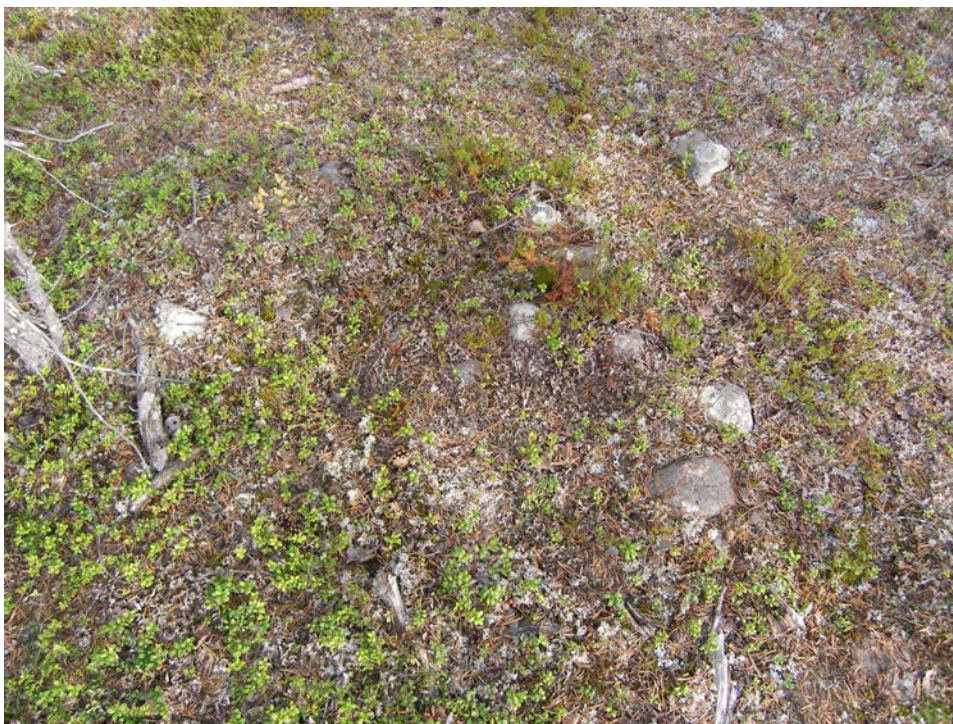
Fig 5. Hård Raä 1423 fotograferad från V.