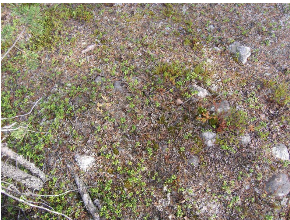
Fig 6. Hård Raä 1423 fotograferad från VNV.