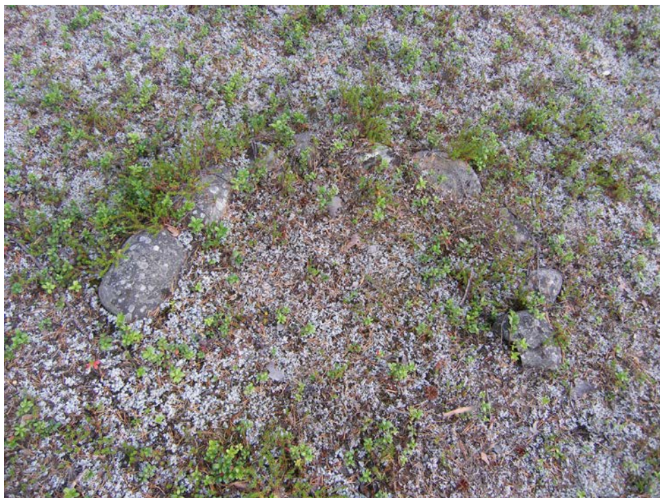
Fig 3. Härd Raä Raä 1963 fotograferad från VNV.