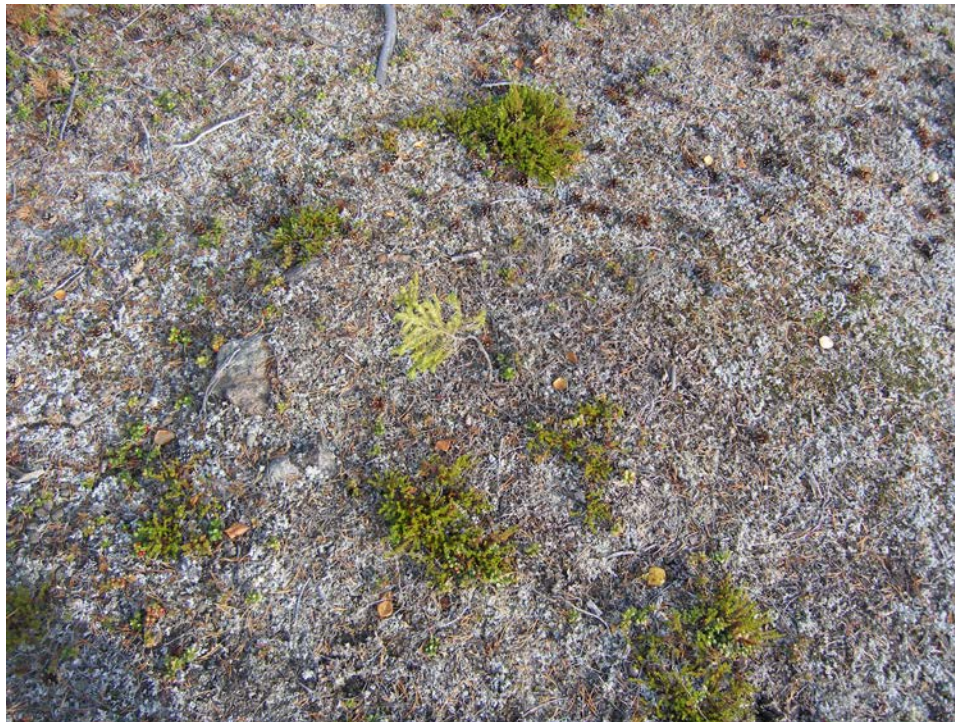
Fig 1. Hård Raä 1965 fotograferad från V.

Arkeologisk utredning för täkt, Jukkasjärvi 2:11 och 3:6, Jukkasjärvi sn, Kiruna kommun, Norrbottens län, Lappland. 15 september 2006.